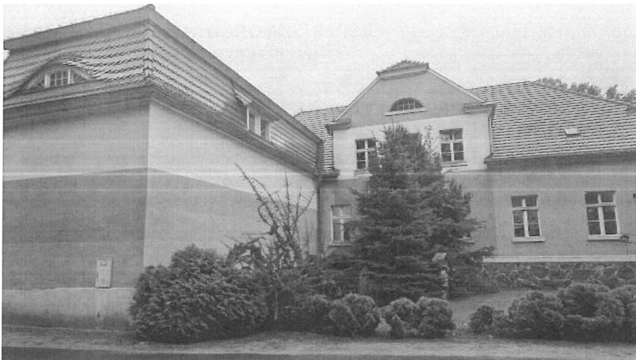
Foto 1. Widok od strony północnej.