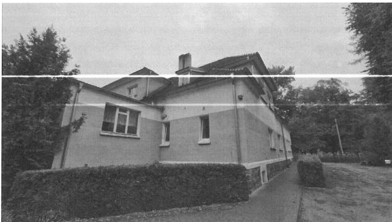
Foto 2. Budynek od strony południowej.