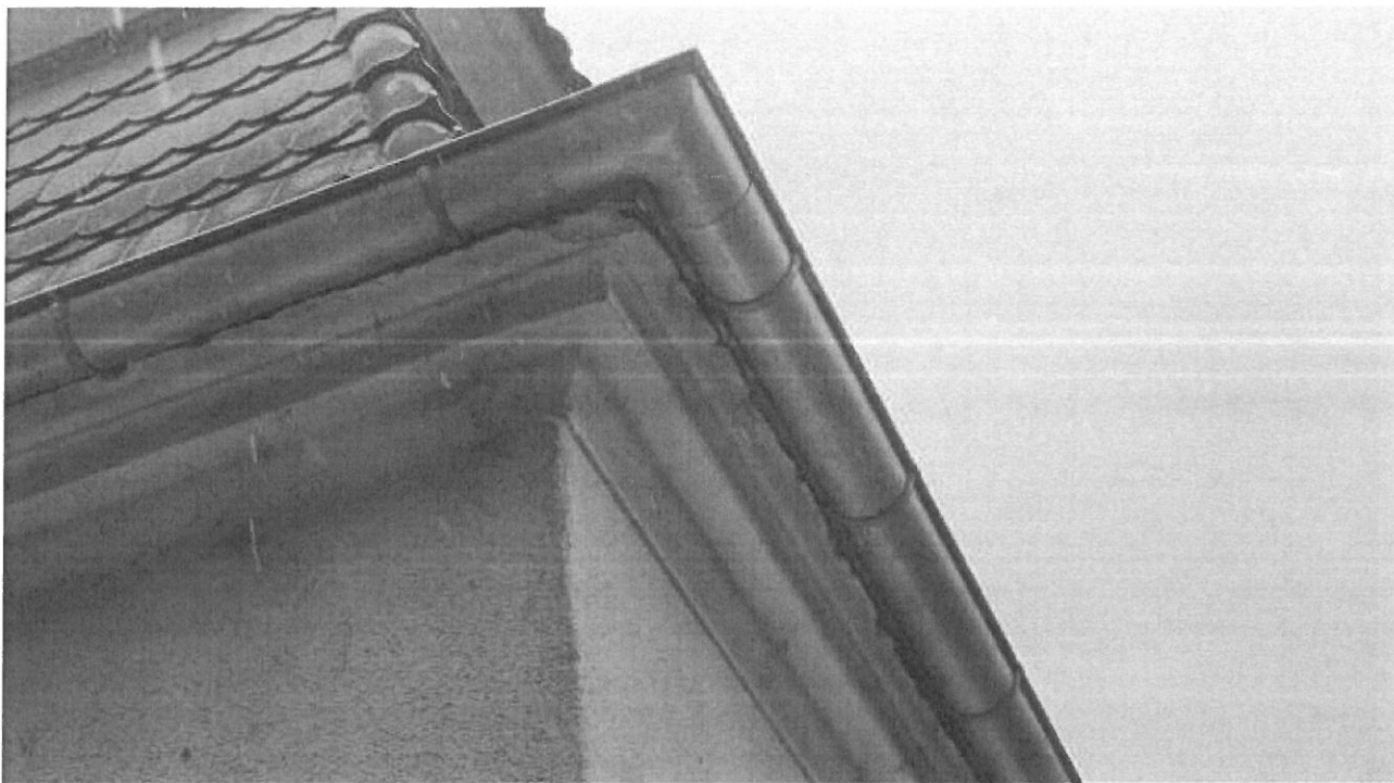
Foto 5. Potencjalne siedliska dla nietoperzy znajdują się w szczelinach pod rynnami.