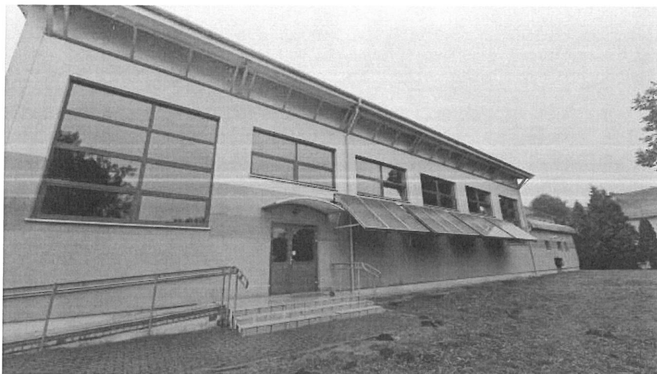
Foto 3. Budynek sali gimnastycznej.